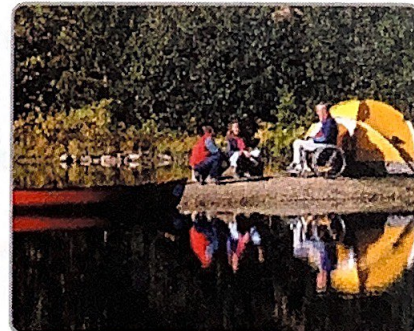
3. Mis amigos y yo