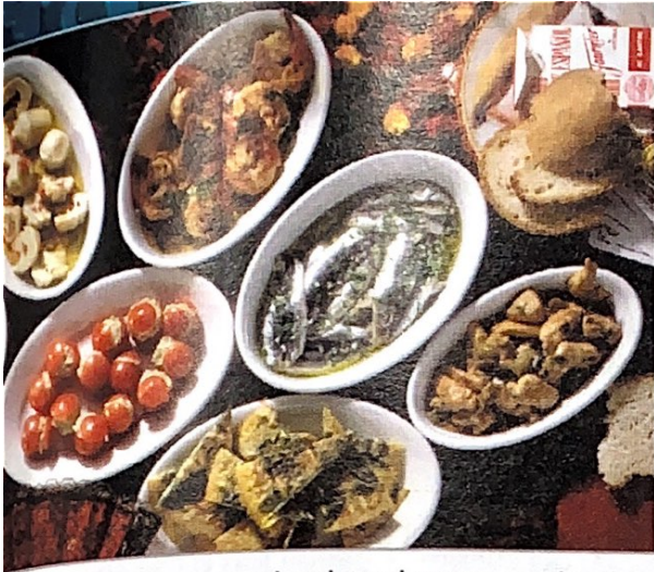
La gente comparte varios platos de tapas cuando sale. Las tapas más populares son la tortilla de patatas, las gambas, las alcachofas y las sardinas.

universitarios que andan por las calles y las plazas cantando y tocando guitarras, laúdes y otros instrumentos tradicionales. Y más tarde se puede escuchar música y bailar en los clubes, donde se tocan canciones populares europeas y de todo el mundo.