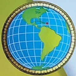
▼ San Juan La capital de Puerto Rico está en el noreste de la isla.