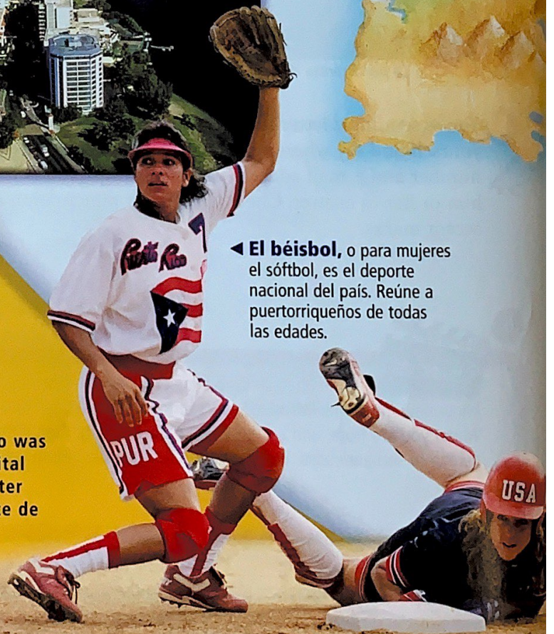
◀ El béisbol , o para mujeres el sóftbol, es el deporte nacional del país. Reúne a puertorriqueños de todas las edades.

Did you know that the island of Puerto Rico was first named San Juan Bautista, and the capital was named Puerto Rico ( rich port )? Only later were the two names switched by Juan Ponce de León, Puerto Rico's first governor.