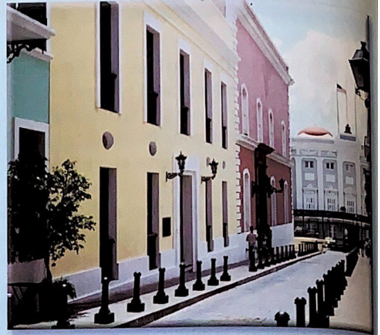
▲ El Viejo San Juan Las calles reflejan la época colonial.