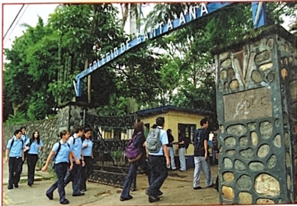
El comienzo del día en el Colegio de Santa Ana