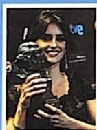
Penélope Cruz recibe el premio Goya

En México , el premio Ariel es la máxima distinción otorgada° a los mejores trabajos cinematográficos mexicanos. La estatuilla° representa el triunfo del espíritu y el deseo de ascensión.