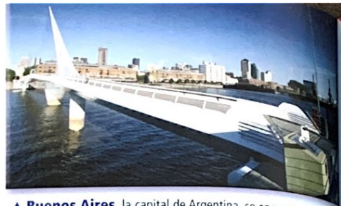
▲ Buenos Aires , la capital de Argentina, se encuentra en la boca del Río de la Plata en la costa del Océano Atlántico.